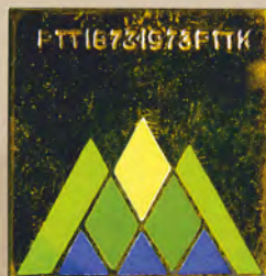
Stulecie turystyki górskiej