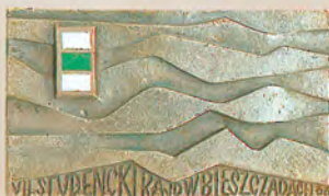
Rajdy Bieszczadzkie Studenckiego Koła Przewodników Beskidzkich z Warszawy 1965, 1966