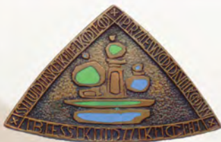
Studenckie Koło Przewodników Beskidzkich w Warszawie