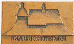
Rajdy w Beskidzie Niskim Studenckiego Koła Przewodników Beskidzkich z Warszawy 1965, 1967, 1968