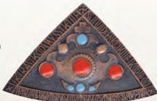
Studenckie Koło Przewodników Górskich w Krakowie