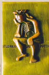
Rajd studencki Beskid Niski ZSP PPTK 1968